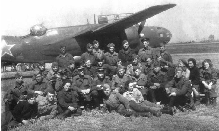
2. ábra: A 48. bombázórepülő ezred Bostonja és az előtte fényképezkedő földi személyzet. Megfigyelhető a szovjetek által átalakított felső lövésztorony.

Harmadikként 9 óra 20 perckor Arad repülőtéréről a 48. bombázó ezred 21 darab A-20 "Boston" bombázója szállt fel. Ez a csoportosítás Garamvezekény (ma Vozokany nad