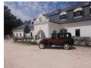
Kállay kúria, Kállósefemjén

Jelentkezési lap kitöltésével a www.oroksegtura.hu weboldalon.