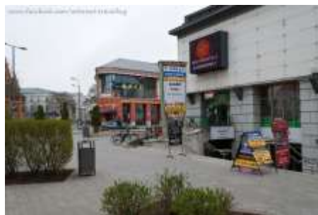
Kossuth tér bal oldala régen és ma