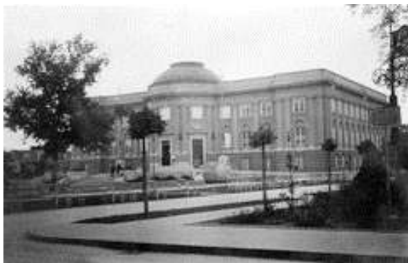
Déri Múzeum (év:1936)