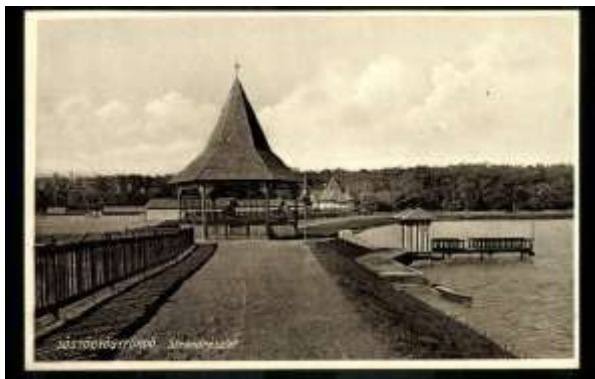
Nyíregyháza -Sóstó (Strandrészlet) (év:1936)