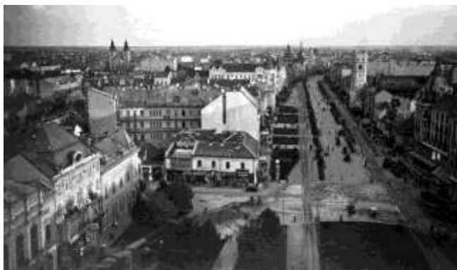
Piac utca a Református Nagytemplomból fotózva (év:1935)