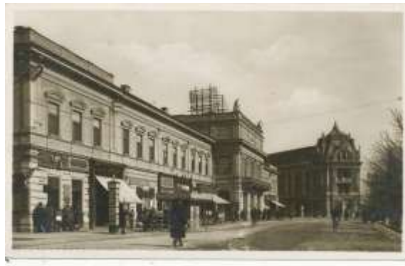
Nyíregyháza belvárosa (év:1935)