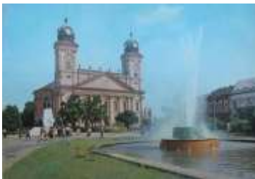
(A Zsolnay zenélő szökőkút 1958-ból)