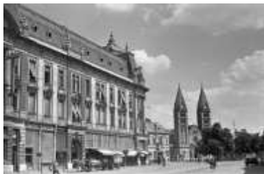
(Kossuth tér 1958-ban)