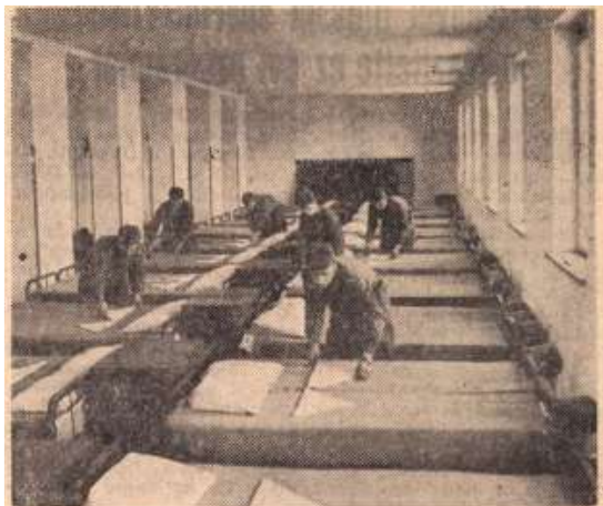
Ilyen a katonás rend! „Vonalba” húzott párnák, törülközők és sisakok, sarkos ágyak. Bizony ilyen rendet egy háziasszony nem tudna csinálni...

1950. november 1-jei dátummal megalakult a 48. lövészezred, és lövészek vették birtokba a Kossuth laktanyát.