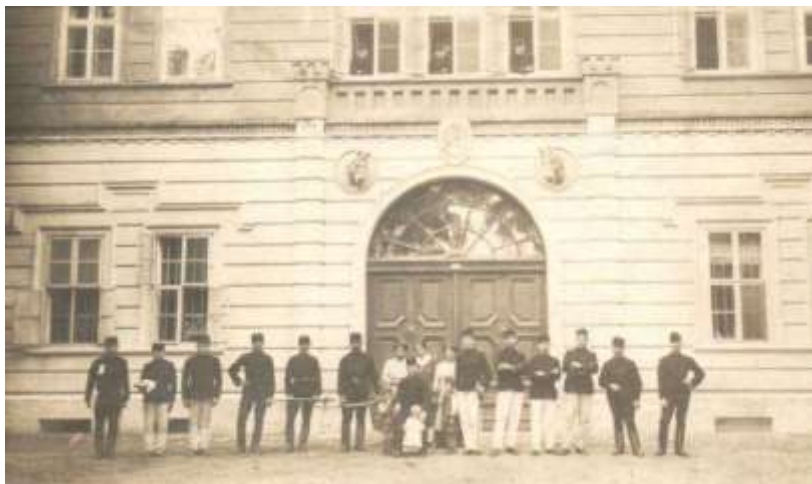
Ez az épületet ma a Böszörményi-Füredi utca sarkán találjátok.

Tudtátok -e, hogy a laktanya területén (sőt a mostaninál jóval nagyobb kiterjedésben) az 1800-as évek végétől Méntelep működött! Debrecenben jelentős esemény volt 1874-ben a Városi Méntelep átadása. Ezt a magyar lótenyésztés magasabb céljaira létesítették akkoron. Az épületegyüttes az Osztrák-Magyar Monarchia korhű, „laktanya-stílusában” épült, 172 m 2 részére, két, hatalmas istállóval. A főépület még ma is áll, igaz, a sok-sok átépítést követően alig felismerhető a hajdani mivolta.