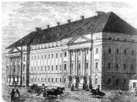
Debreceni Kollégium épülete 1848-ban