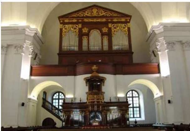
A Református Nagytemplom belülről

A Főrendi Ház a Bárczy-házban (Podmaniczky-házban) ülésezett, míg a Képviselőház a Református Kollégium Oratóriumában. 1849. április 14-én a Református Nagytemplomban tartották az országgyűlés nyílt ülését, melyen kimondták a Habsburg-Lotharingiai uralkodóház trónfosztását, hazánk függetlenségét és Kossuth Lajost kormányzó elnökké választották.