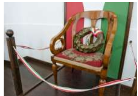
Kossuth Lajos széke a Református Nagytemplomban