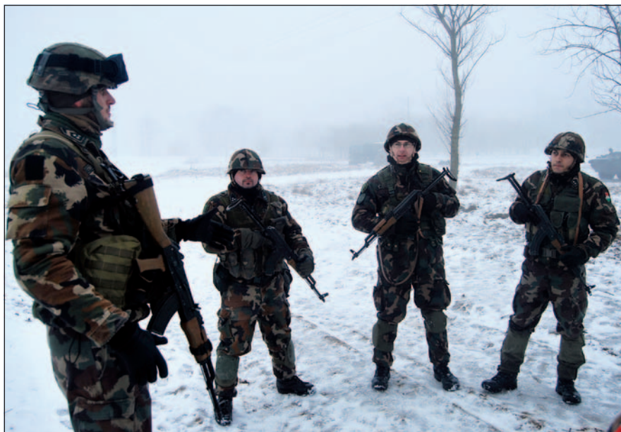
A kijelölt állomány gyakorlati módszertani foglalkozáson a hajdúhadházi gyakorlótéren

2013. januárban – az előző években megszerzett ismeretanyagra építve – tovább folytatódott a raj-