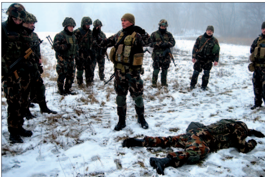
A felkészítési folyamat végén érezhetően gyarapodott a részt vevő katonák harcászati ismerete és az önbizalma

parancsnoki állomány szakmaiságának elmélyítése. A kéthetes felkészítés célja az volt, hogy az MH ZHCS-II állományába beosztott rajparancsnoki, valamint rajparancsnok-helyettesi állomány egységesen legyen felkészítve a CREVAL-ellenőrzés eredményes végrehajtására, valamint hogy egységesítve legyen a parancsnoki állományra vonatkozó ismeretanyag. Az első héten Debrecenben tanteremben oktatták az elméleti anyagot. A második héten a hajdúhadházi gyakorlótéren gyakorlati foglalkozások keretében, harcászati körülmények között dolgozták fel az előírt témaköröket a résztvevők a 39. lövészászlóalj század vezénylőzászlósainak és a szakaszok altisztjeinek koordinálásával.